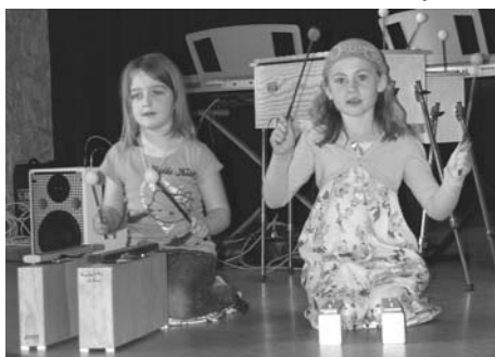
Die Kleinsten genossen ihren ersten Auftritt.

„Erfolg ist die Belohnung für harte Arbeit.“ Dieses Zitat des griechischen Dichters Sophokles bewahrheitete sich am Konzert der Musikschule Gettnau auch für die jungen Musizierenden, die für ihre musikalischen Leistungen mit rauschendem Applaus belohnt wurden. Und diesen Beifall haben sie sich redlich verdient, haben sie doch zahlreiche Stunden hart gearbeitet, um mit Erfolg ihre Darbietungen zu präsentieren. Lautstarke Anerkennung durften sämtliche Kinder entgegennehmen, ob sie im frei zusammengestellten Ensemble von Flöten, Xylophon und Klavier mitspielten oder mit solistischen Vorträgen auf Blechblasinstrumenten vor das Publikum traten, oder im Duett auf dem Keyboard.